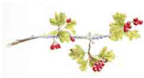
Aquarelle d'Isabelle Naudin

Photographies de Pierre Soissons et aquarelles d'Isabelle Naudin - Du 1 er juin au 25 septembre 2016 - Au jardin de Saint-Martin, à Ruynes-en-Margeride - Ouverture selon les horaires du site ou sur réservation - Tél. : 04 71 23 43 32