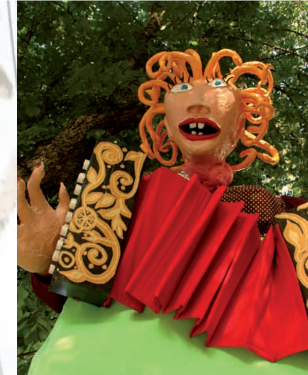
Roncos do Diabo