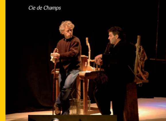
Cie de Champs